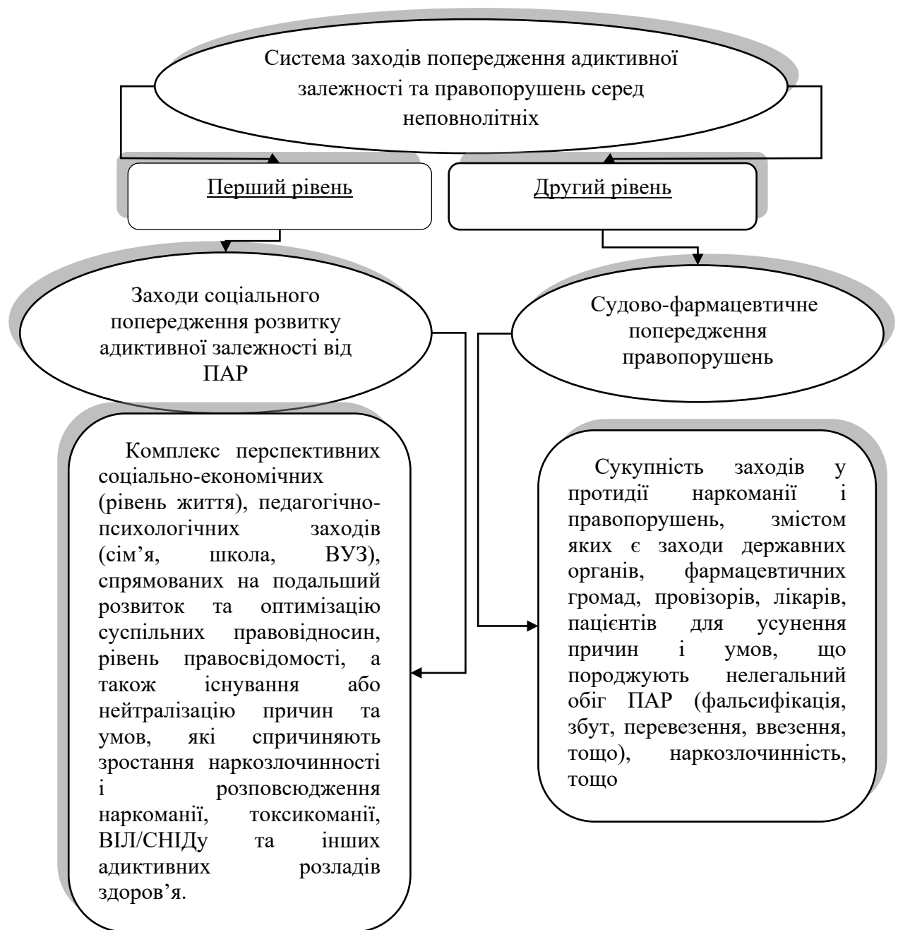
Рис. 4. Дворівнева система заходів попередження розвитку адиктивної залежності та правопорушень серед неповнолітніх

Другий рівень системи заходів має на меті судово-фармацевтичне попередження наркозлочинності серед неповнолітніх, до проведення яких залучаються співробітники правоохоронних органів. Його можна умовно поділити на декілька частин: судово-фармацевтичне випередження; судово-фармацевтичне обмеження; судово-фармацевтичне усунення; судово-