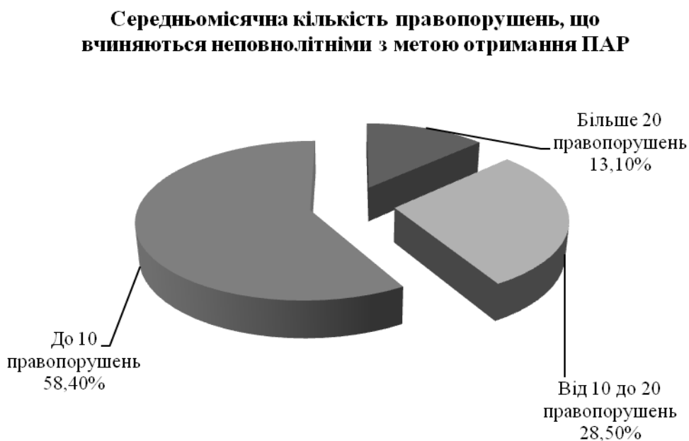
Рис. 3. Середньомісячна кількість правопорушень, учинених неповнолітніми з метою отримання психоактивних речовин

Встановлено, що найчастіше з метою отримання ПАР неповнолітні учиняють близько 10 правопорушень на місяць різного ступеня тяжкості (рис. 3). Проте понад 10,00 % респондентів відмітили, що неповнолітніми учиняються більше 20 правопорушень на місяць. Такий розбіг поглядів пояснюється тим, що респонденти вказують дані не тільки по м. Харкову, а й по різним районах Харківської області.