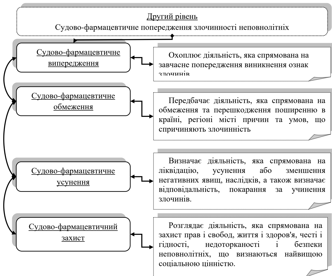
Рис. 5. Складові другого рівня системи заходів попередження розвитку адиктивної залежності та наркозлочинності серед неповнолітніх

фармацевтичний захист. У результаті поділу другий рівень системи заходів попередження матиме такий вигляд (рис. 5).